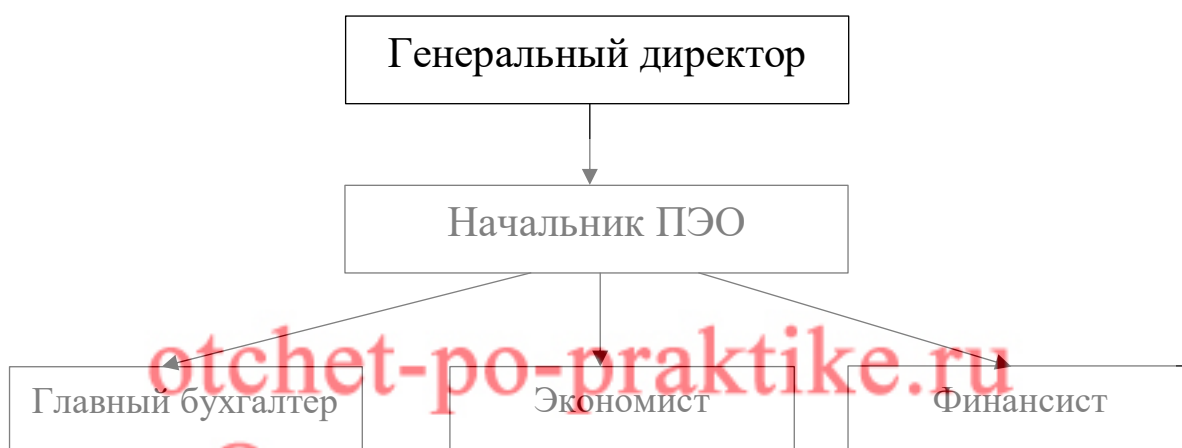
Рисунок 2 - Структура планово-экономического отдела

Структура планово-экономического отдела ООО «ВентКомплекс» представлена на рисунке 2.